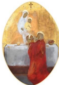
MOLNÁR IMRE Áldozatból fakadó szentség és küldetés Magyar Irodalom és Képzés kiadvány

„Az általunk eddig ismert történelmi tények mögött ott húzódik egy másfajta történelem is. Egy olyan eseményfonál, esetünkben a magyarság íratlan történelmiaranyfonala, melyet nem mi emberek írunk itt a földön a magunk véges eszközeivel. Erről a történelem mögötti történeletről elmélkedik Dümmerth Dezső történész is, aki ezt a folyamatot titokzatos jelbeszédként írja le népünk több mint ezeréves történelme során is. A gondviselő Isten tervének megvalósulása, gyümölcse leginkább azoknak az embertársainknak az életében fedezhető fel, akik az isteni gondviselés eszközeként képesek voltak együttműködni a Teremtő rájuk vonatkozó terveivel. Az ő életükben felfedezhetjük azt a jelet, amely nemcsak a saját létük, hanem az őket körülvevő társadalom és nemzet élete számára is üzenetként értelmezhető.”