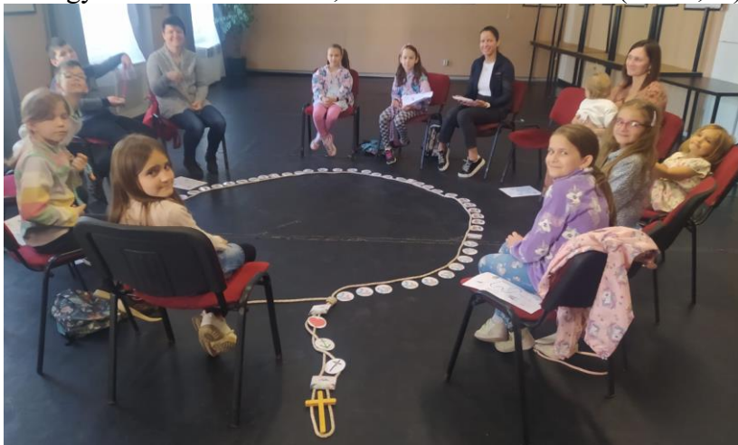
A gyerekek Gyöngy csoportjának évzáró imaalkalma (békéért)

Aki szeretne közösséghez tartozni, megtalálhatja a számára ideálisat. Bízatom is a kedves testvéreket, hogy csatlakozzanak, vagy bátran alakítsanak új csoportokat. Mert ahol ketten-hárman összegyűlnek Jézus nevében, ott van közöttünk Ő is. (Mt 18,20)